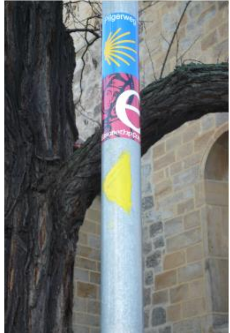
@ Jakobus-Pilgergemeinschaft Göttingen e.V.