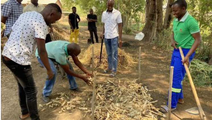
Sambische Bauern beim Ansetzen eines Komposthaufens

Partnerschaft seit 2006, seit 2020 auch mit Kasisi/Sambia