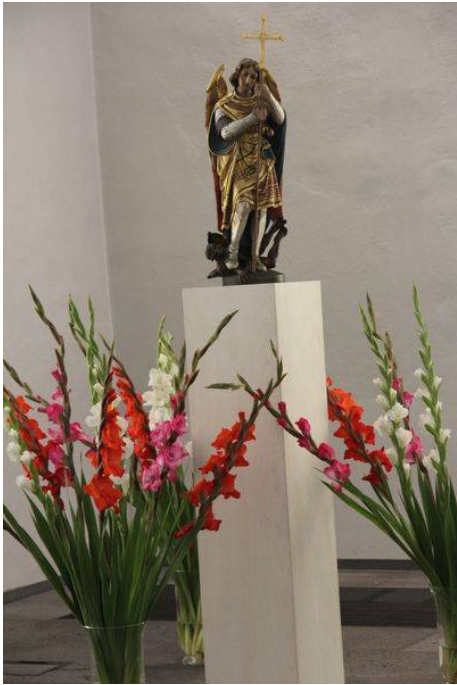
Erzengel Michael

Zum Patronatsfest hatte sich für die Messe um 11:30 Uhr der Kirchenchor St. Vitus Sünninghausen-Oelde angesagt. Doch es kam anders.